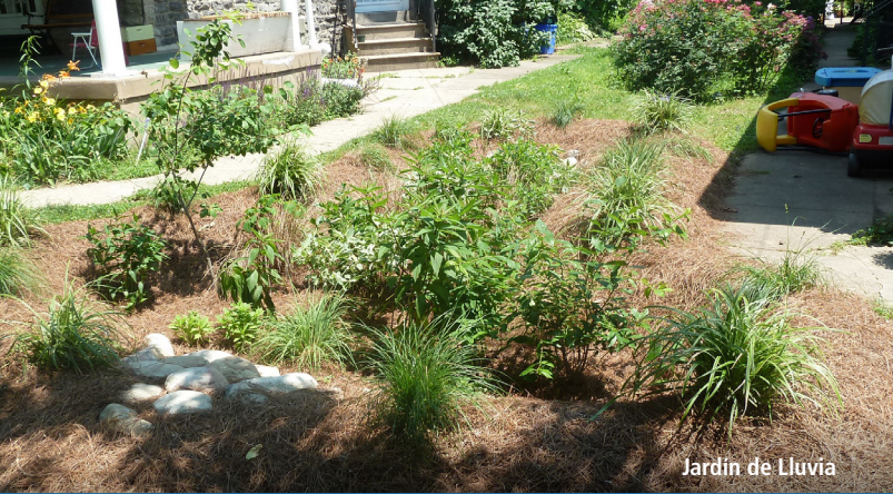
Jardín de Lluvia